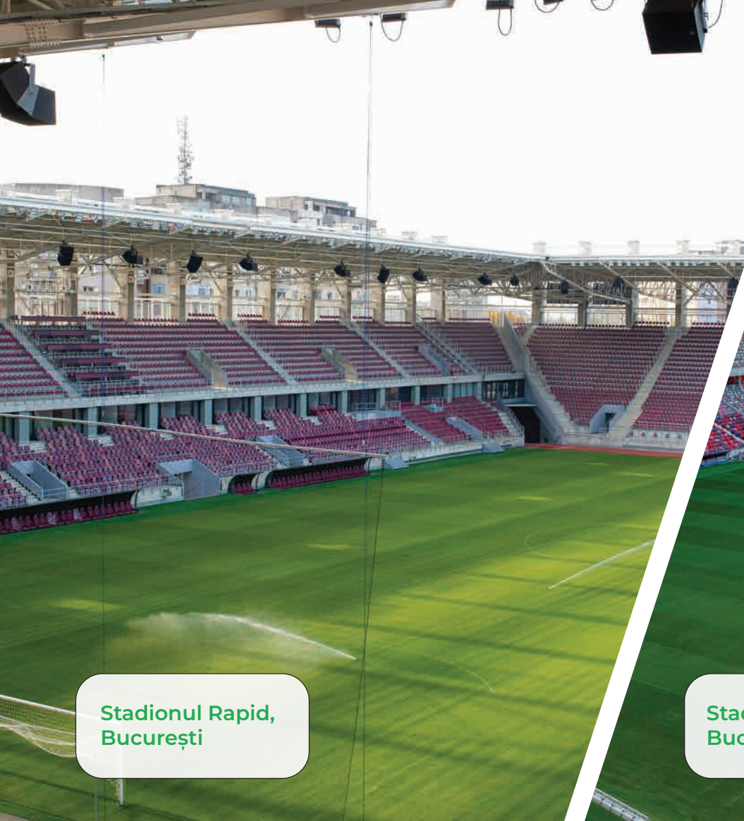
Stadionul Rapid, București