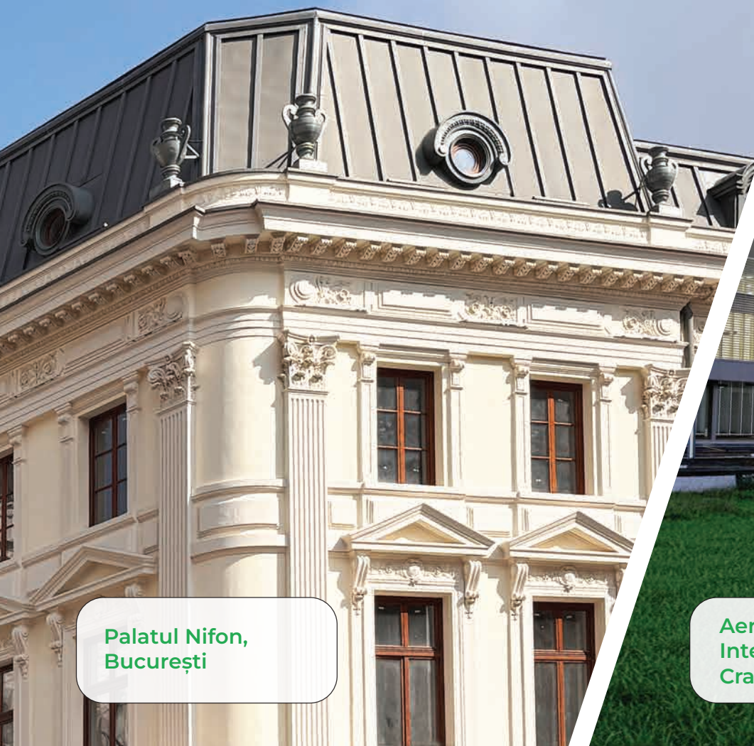
Palatul Nifon, București