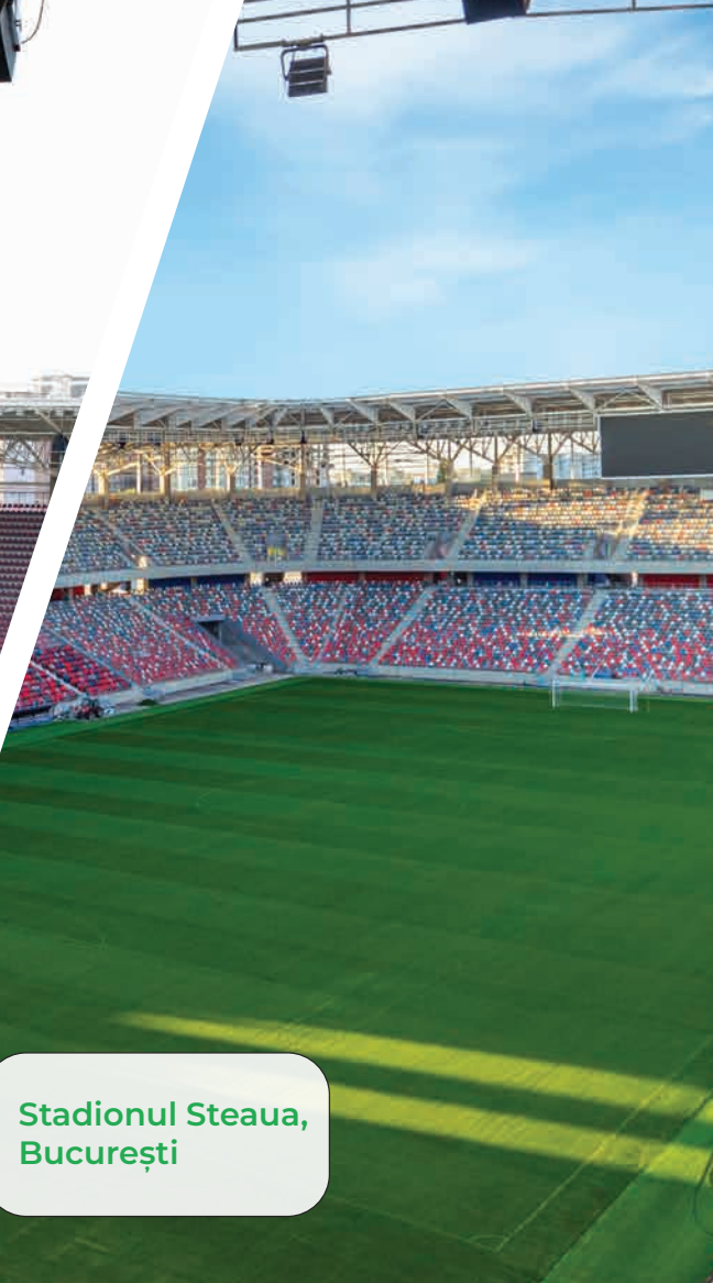
Stadionul Steaua, București