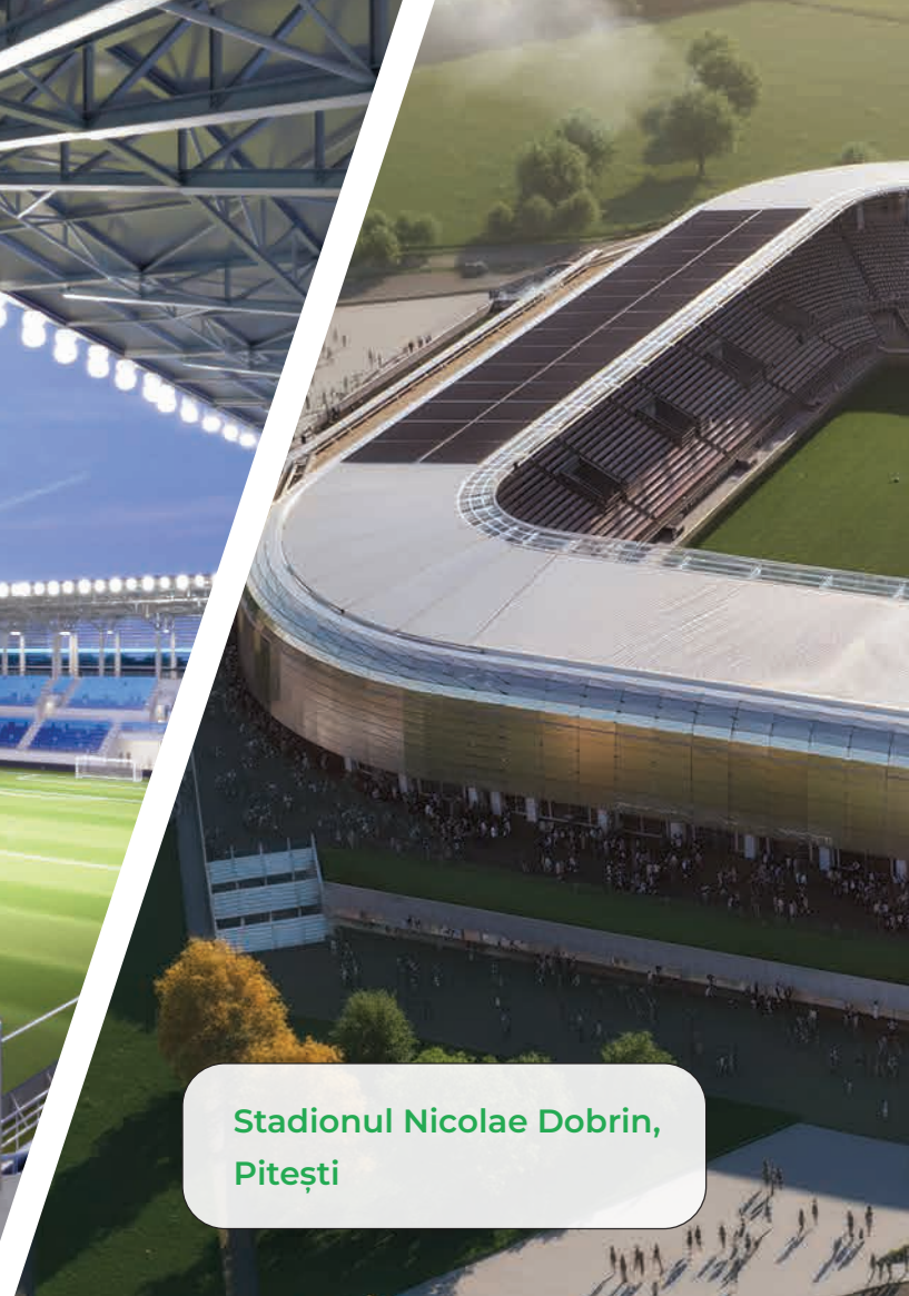
Stadionul Nicolae Dobrin, Pitești