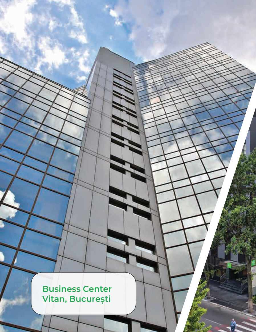
Business Center Vitan, București