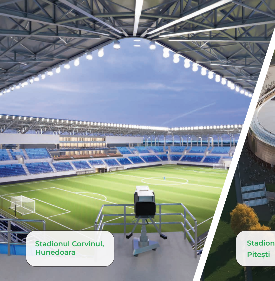
Stadionul Corvinul, Hunedoara