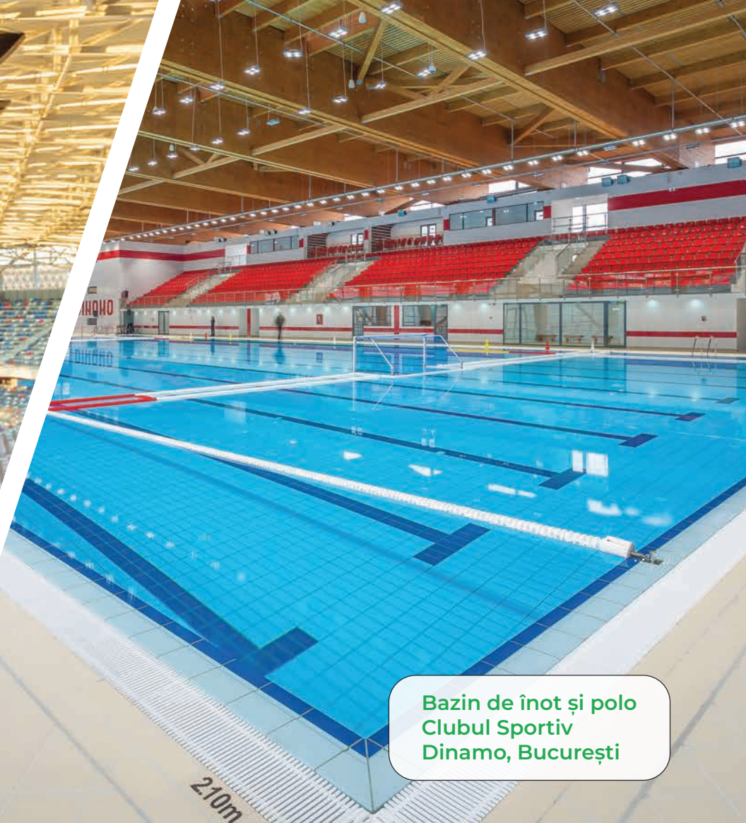
Bazin de înot și polo Clubul Sportiv Dinamo, București