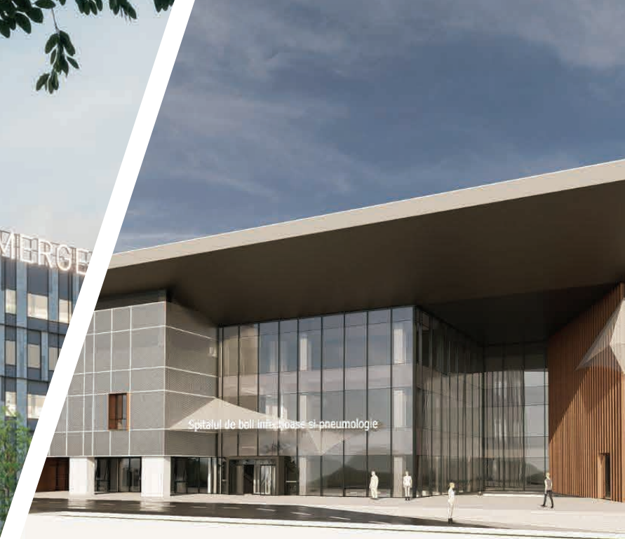
Spitalul de Boli Infecțioase Oradea