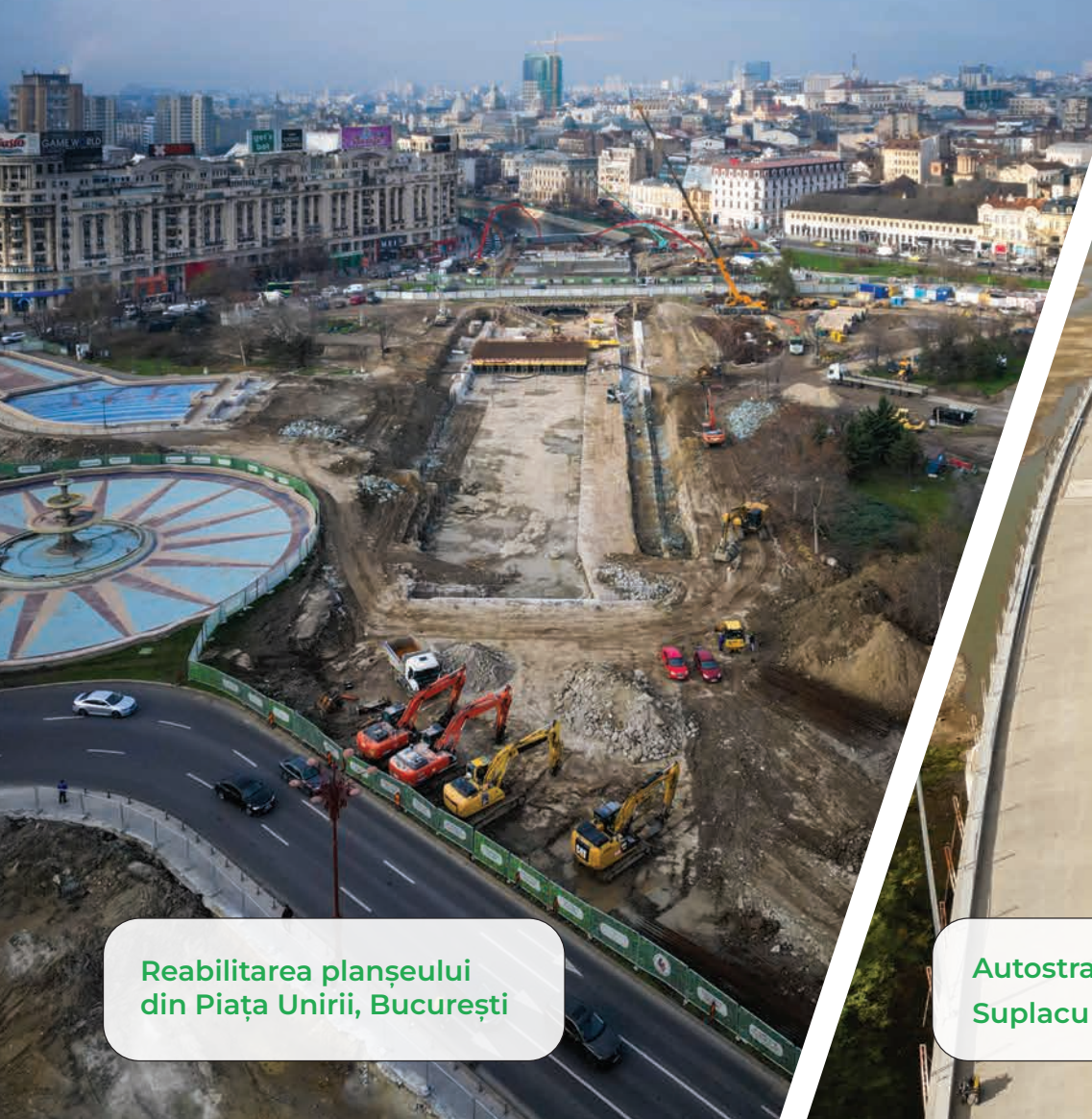
Reabilitarea planșului din Piața Unirii, București