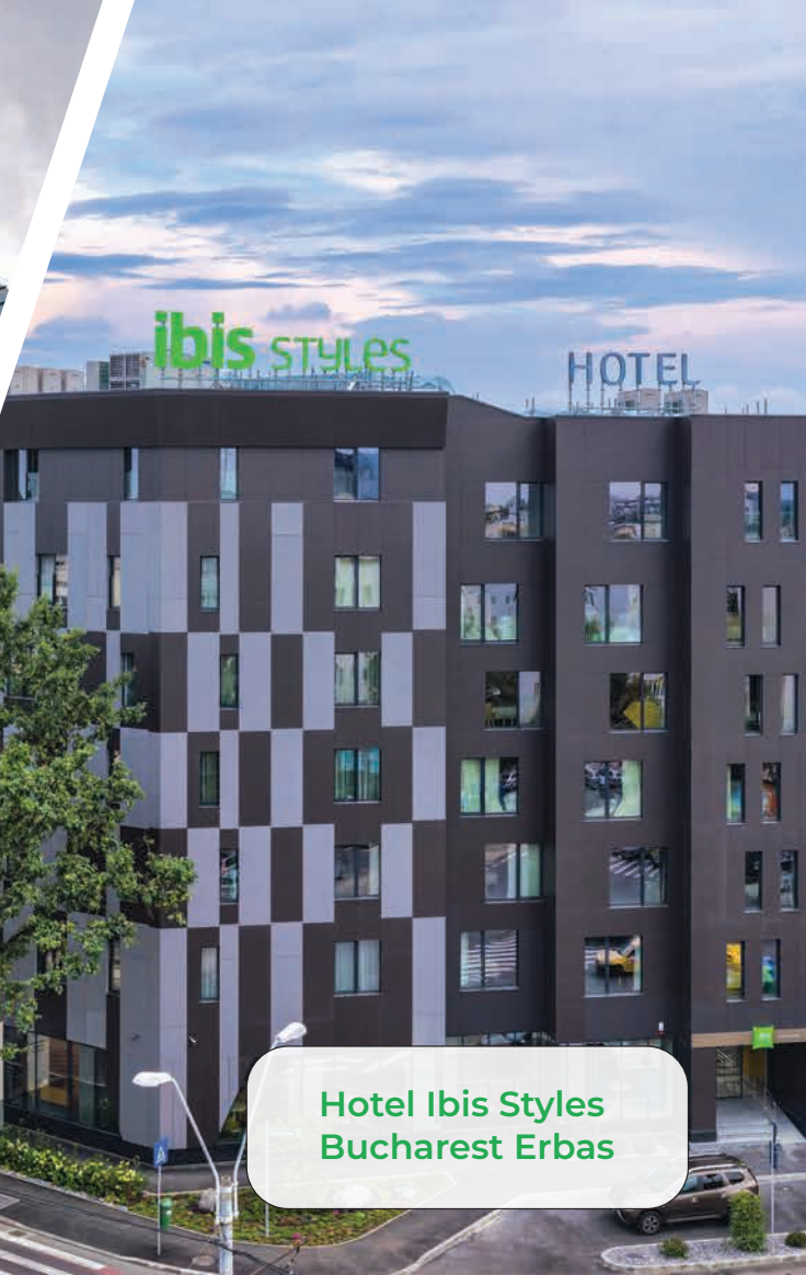
Hotel Ibis Styles Bucharest Erbas