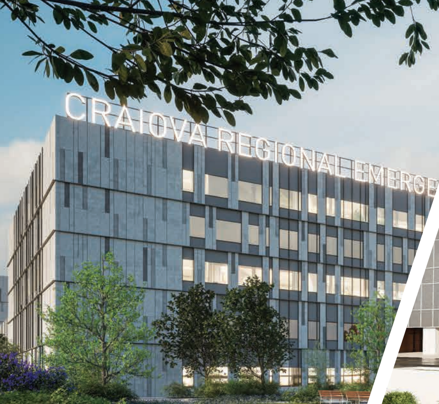
Spitalul Regional de Urgență Craiova