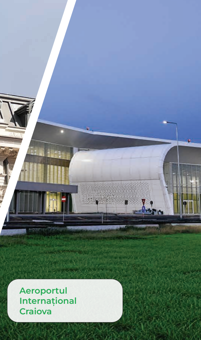
Aeroportul Internațional Craiova