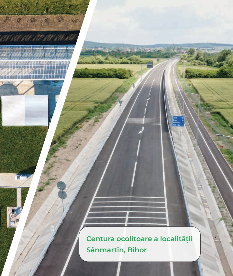
Centura ocolitoare a localității Sânmartin, Bihor