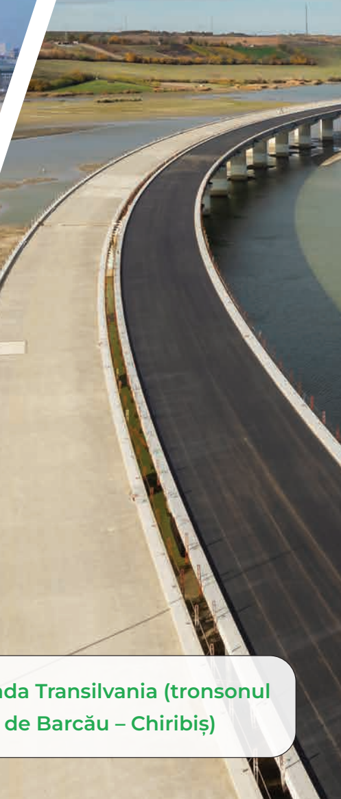
Autostrada Transilvania (tronsonul Suplacu de Barcău – Chiribiș)